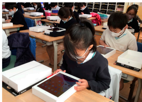
iPadを初めて起動してネットワークに接続すると、Jamf Schoolの管理化に置かれ、初期設定が自動で適用されます。児童が設定作業する必要はなく、すぐに使い始められます。