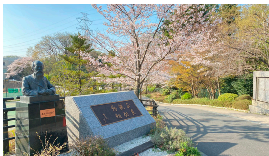
森村学園の校舎やグラウンドは自然林に囲まれ、緑豊かな環境の中で学園生活を送ることができます。

そんな森村学園 初等部でiPadを初めて導入したのは2017年6月。自然豊かな校舎内でも利用できるセルラーモデルのiPadを児童用に40台、教員用に40台を導入したあと、翌年には児童用80台を追加し、現在は640台にまで端末数が増加しています。3年生～5年生は1人1台、1、2年生と6年生は280台のiPadを共用していますが、来年度には全学年分の台数が揃い、1人1台の環境が整います。