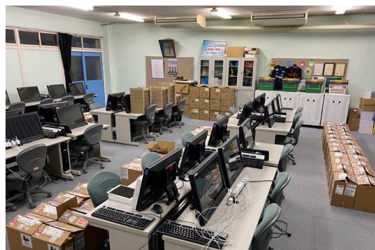
現在、640台ものiPadを導入する森村学園 初等部。一度に480台が届いたときはあまりの多さに先生方一同驚いたと言います。

しかし、森村学園 初等部では決してiPadを子どもたちが使いにくいよう制限ガチガチに縛ることはしません。あくまで一番重要なのは、子どもたちがiPadをいかに効果的に活用できるのか。まさに、教育理念に基づいた「子どもたち主体」でデザインしています。Jamf Schoolへ移行して最低限の管理を簡便に行うことで、教員が子どもたちへ向き合う時間を創出する。Jamf Parentを活用して端末管理を保護者にも任せると、ICT教育による学習効果やリテラシーを家庭でも高めてもらう。そうした取り組みによって、単なる端末導入にとどまらない、トータルな新しい学びの環境づくりを実践しているのです。