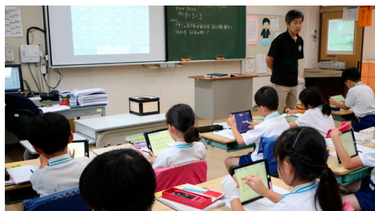
iPadを使って学習する児童たち。探究型学習のみならず、国語や算数などさまざまな授業でiPadを活用します。